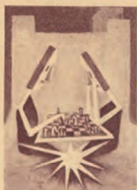
Circolo Scacchistico "Città di Marostica" Via S. Antonio, 8