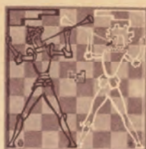
Associazione Pro Marostica