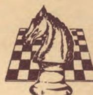
FSI Federazione Scacchistica Italiana Lega Regionale Veneta per gli Scacchi